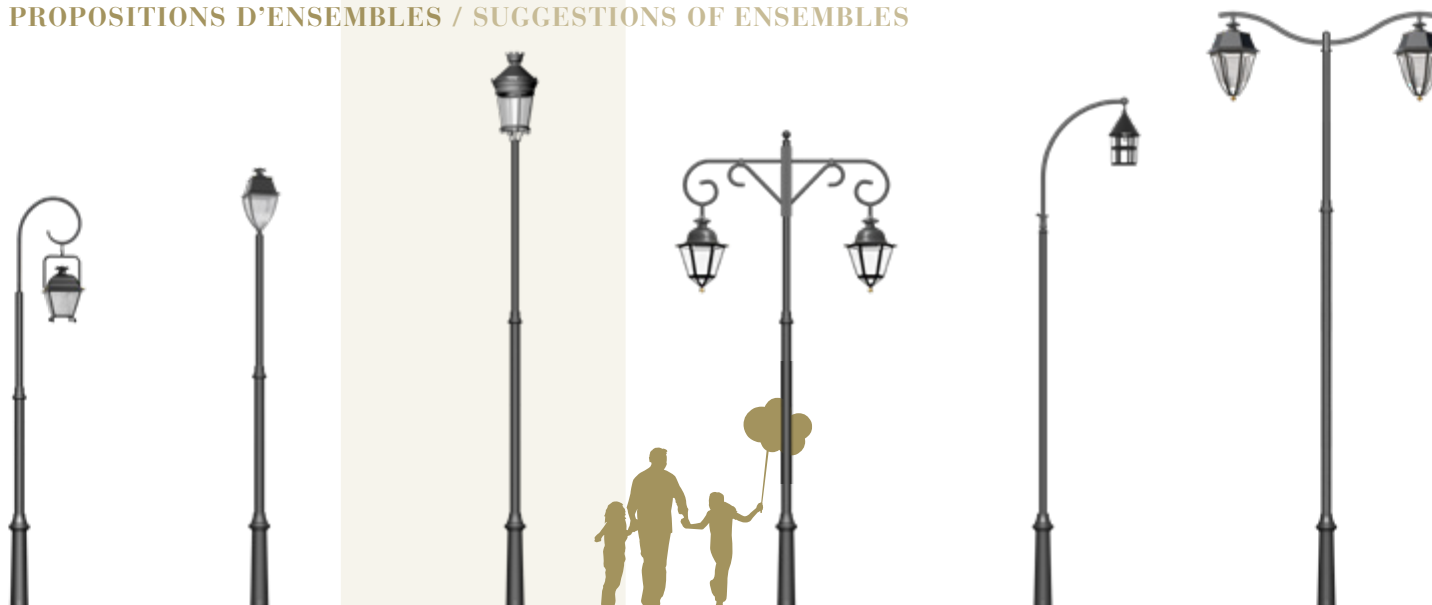
ILION 350 OLYMPIA 48 MANDELIEU 640