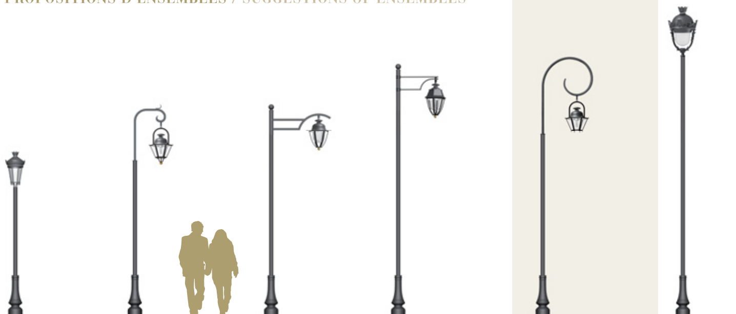
PHOENIX 250 MONACO 638