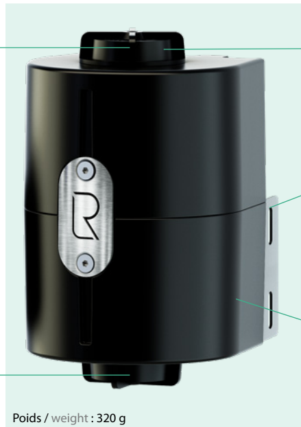
Poids / weight : 320 g

Pour organe smart sur le dessus et le dessous du boîtier / For smart device on top and bottom of the case.