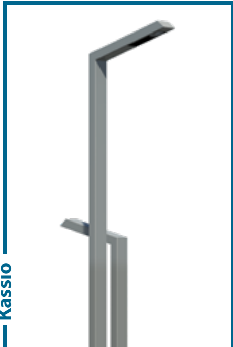
Propositions d'ensembles Suggestions for ensembles