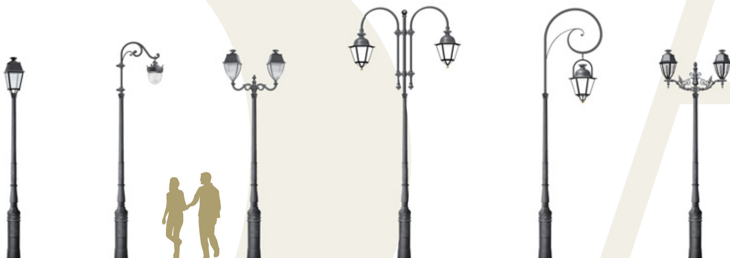
BAUCIS 350 VENCE 638