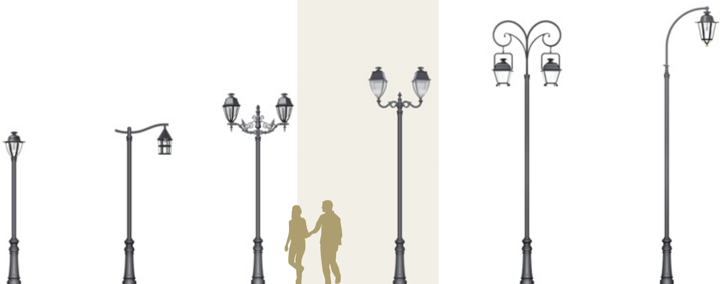
HÉLIOPOLIS 280 VALBONNE 640