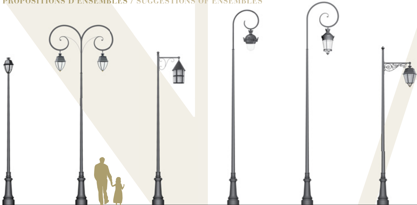
NAUSICAA 500 MOUGINS 640