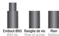
Finitions / Finishes