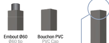
Finitions / Finishes